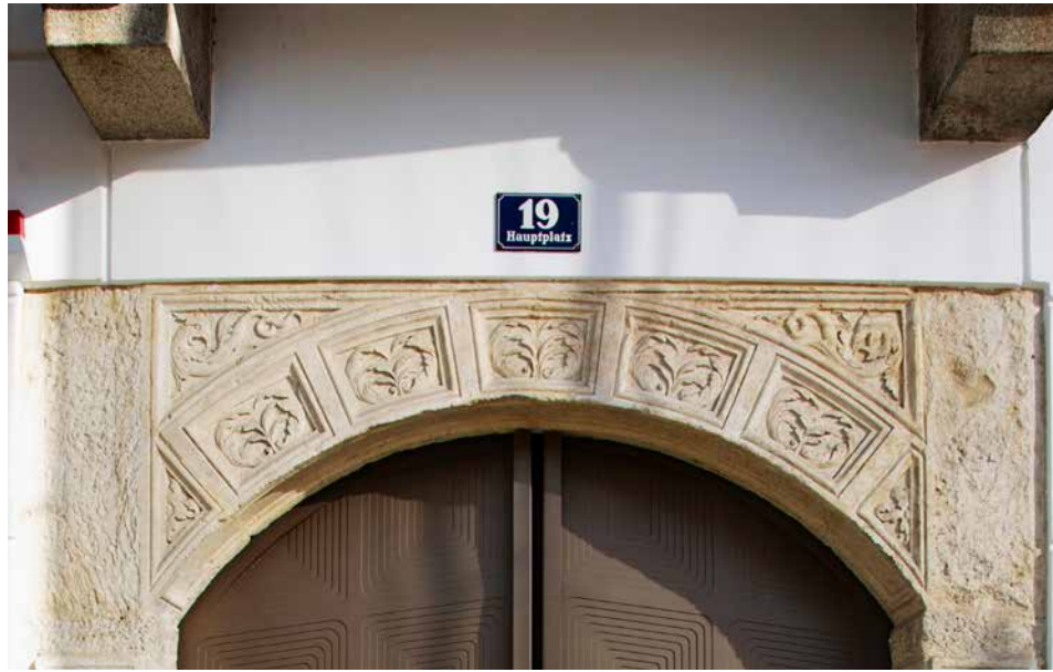
Karl Heinz Klopf