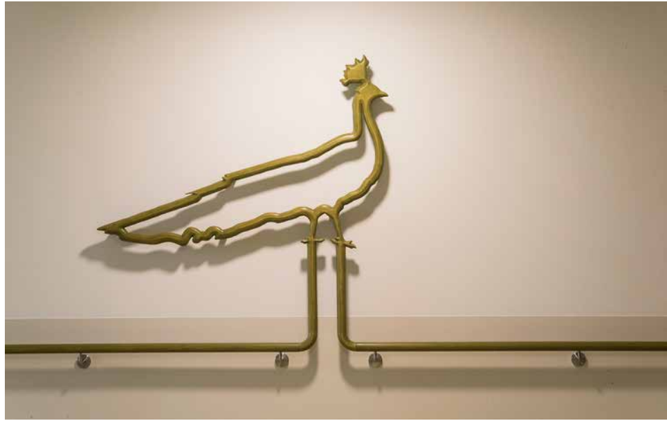
Anita Selinger