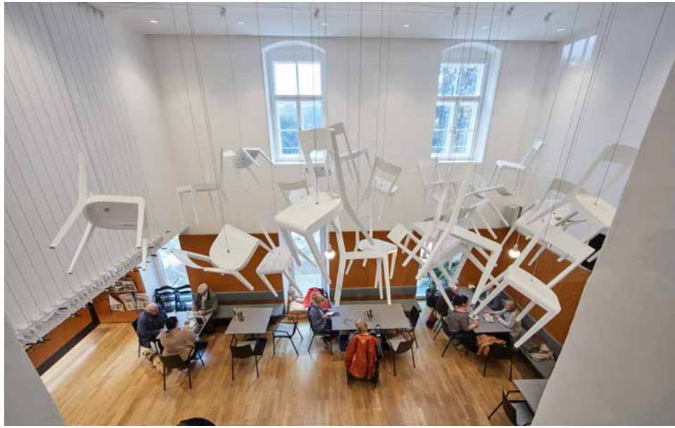
Andreas Strauss Fotos © Edwin Enzlmüller