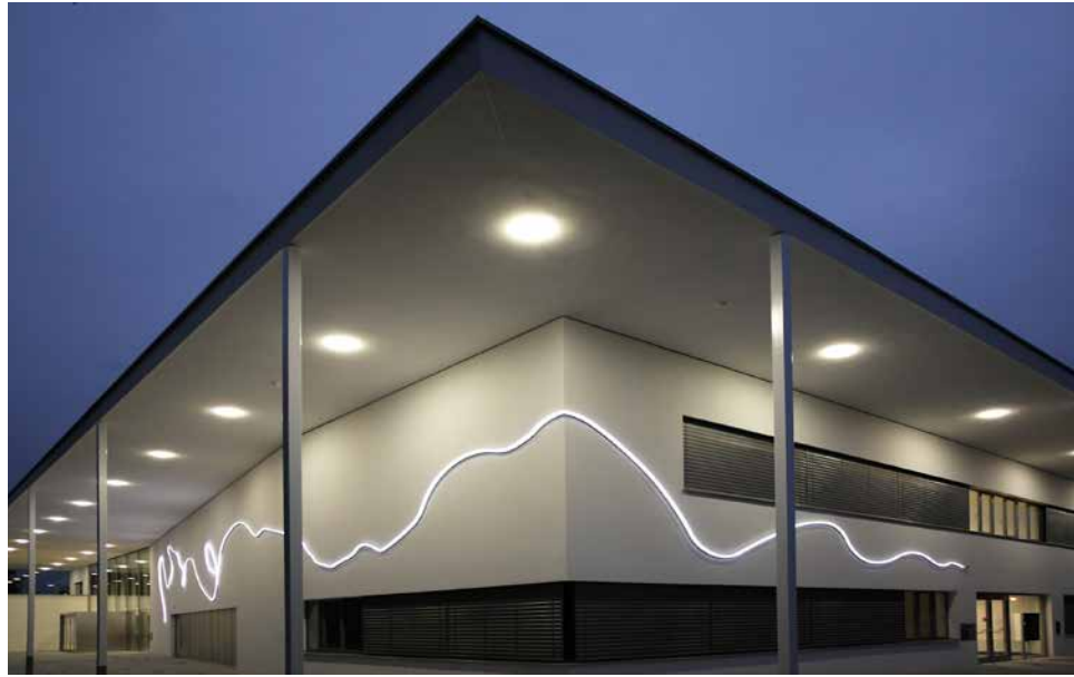
Iris Andraschek/Hubert Lobnig