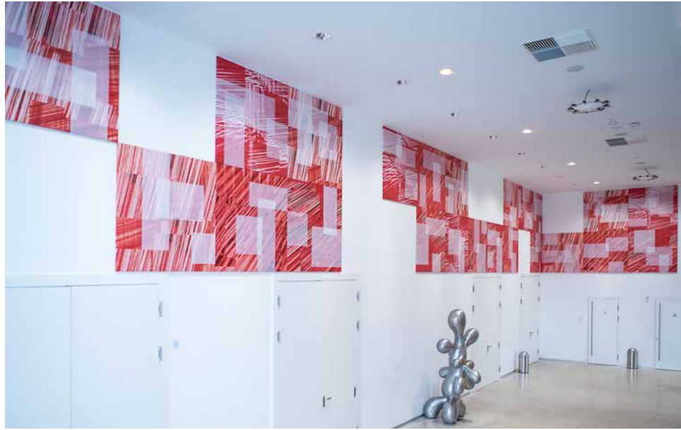
Ingrid Tragler