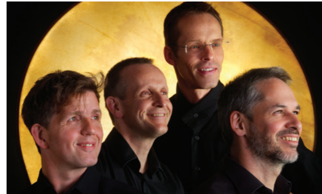
Schlagquartett Köln