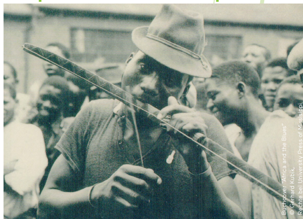
"Buglover Africa and the Blues" © Gerhard Kubik, Rechte bei University Press of Mississippi