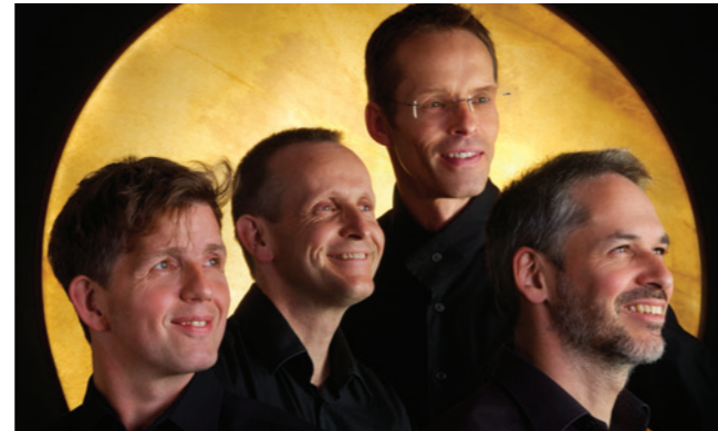
Schlagquartett Köln